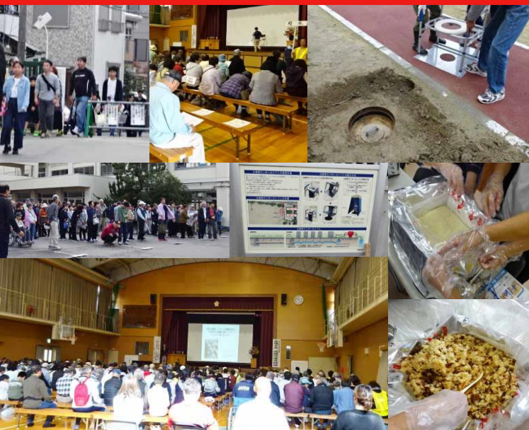
校区一斉避難所運営訓練