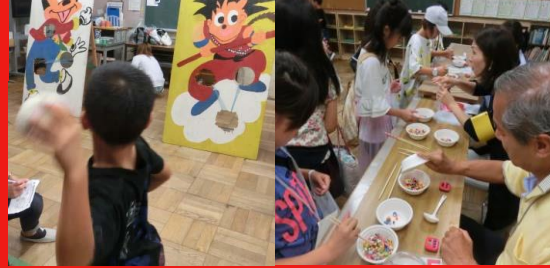
長八スポーツフェスティバル